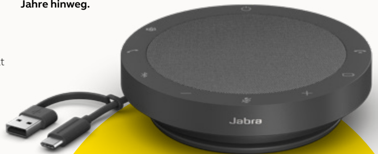
MS TEAMS- UND UC-VARIANTEN

Wir berücksichtigen den Aspekt der Nachhaltigkeit in jeder Phase der Produktentwicklung. Deshalb haben wir das Gehäuse der Speak2 55 aus über 50 % nachhaltigen Materialien** gefertigt und eine Reihe von Bauteilen integriert, die repariert oder ersetzt werden können. Mehr Nachhaltigkeit bedeutet eine längere Lebensdauer deiner Freisprechlösung – und sorgt für Gespräche in hoher Sprachqualität für dich und dein Team über Jahre hinweg.